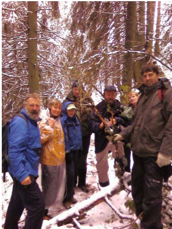
Časť účastníkov tohtoročného memoriálu